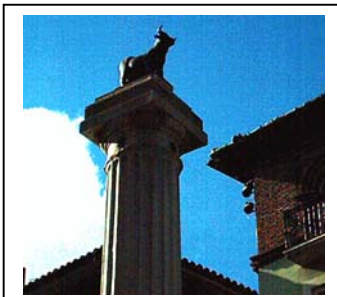
08nov2009 – el Torico, punto de encuentro – Teruel