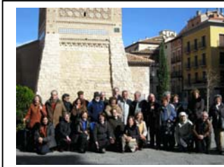
08nov2009 – dispuestos a visitar la ciudad – Teruel