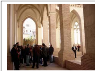
08nov2009 – claustro gótico del Mausoleo de Los Amantes– Teruel