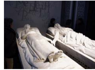
08nov2009 – se muere de amor: Mausoleo de Los Amantes – Teruel