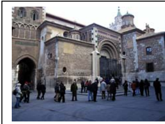
08nov2009 – visitamos la Catedral de Sta. Mª de Mediavilla – Teruel