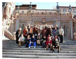
08nov2009 – excelente fondo de podium para el coro– Teruel