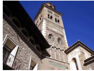
08nov2009 – Torre de la Catedral – Teruel