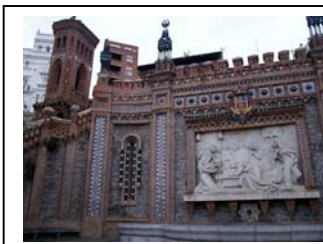
08nov2009 – 08nov2009 – Los Amantes, relieve de Aniceto Marinas– Teruel