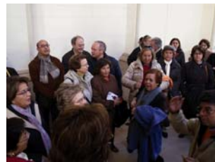
08nov2009 – también cantamos en el Mausoleo de Los Amantes– Teruel