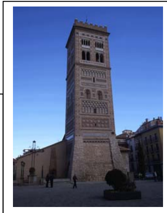
08nov2009 – Torre de San Martín – Teruel