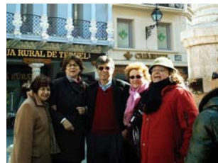
08nov2009 – disfrutando en la Plaza del Torico – Teruel