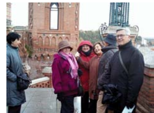
08nov2009 – sobre La Escalinata neomudéjar de José Torán– Teruel