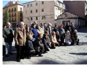
08nov2009 – el grupo en escorzo – Teruel